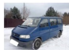
Volkswagen Transporter T4 dużo no... 13 600 zł