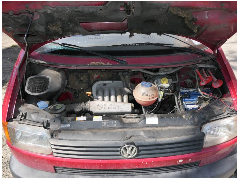
Fot. 5. VW Transporter