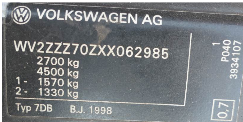
Fot. 11. VW Transporter