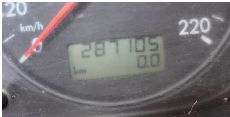
Fot. 10. VW Transporter