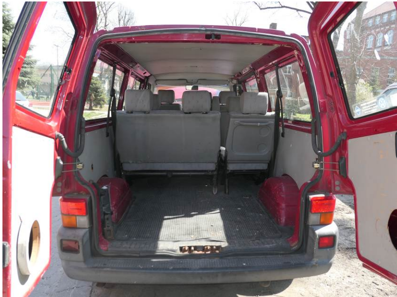
Fot. 9. VW Transporter