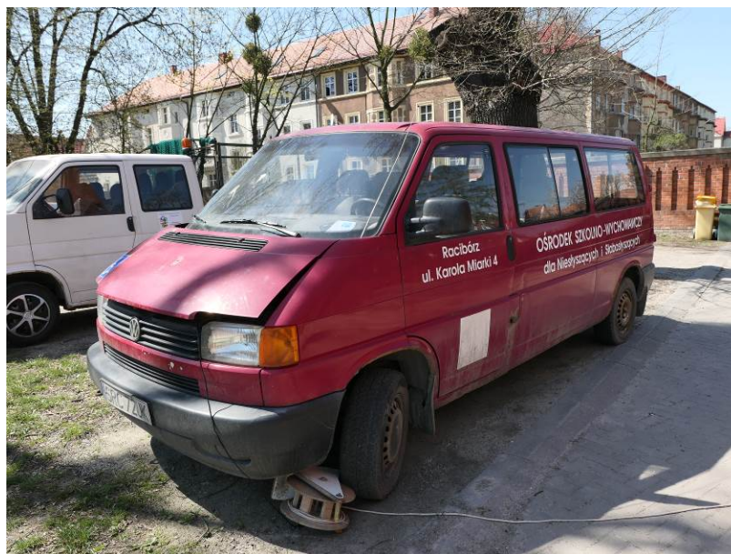
Fot. 1. VW Transporter

Widok ogólny samochodu VW Transporter pokazano na poniższych zdjęciach