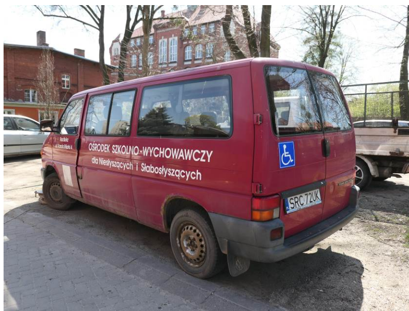
Fot. 2. VW Transporter