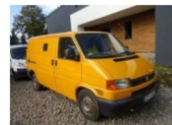
Volkswagen transporter T4 2001 8 500 zł