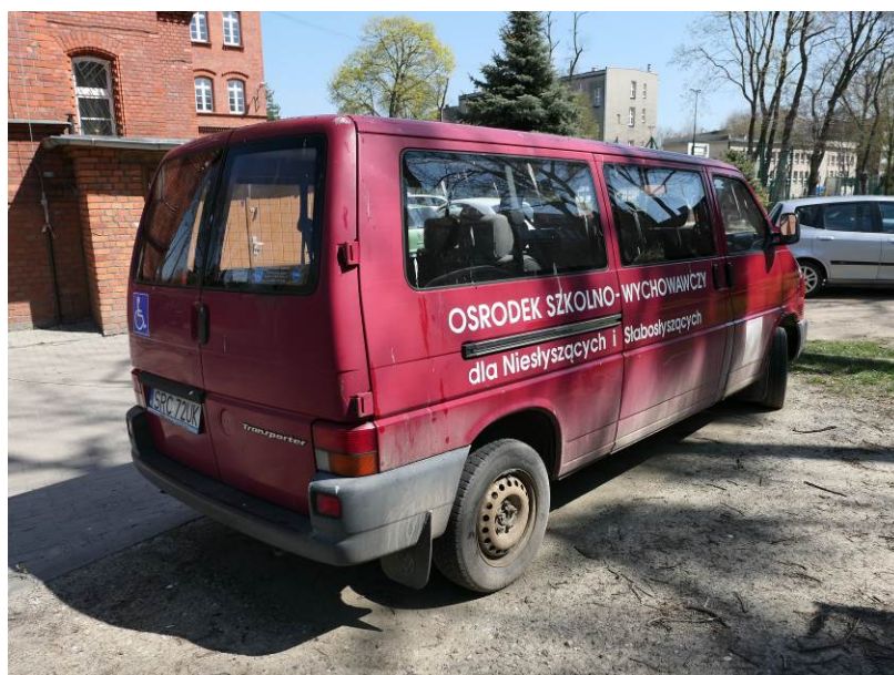
Fot. 3. VW Transporter