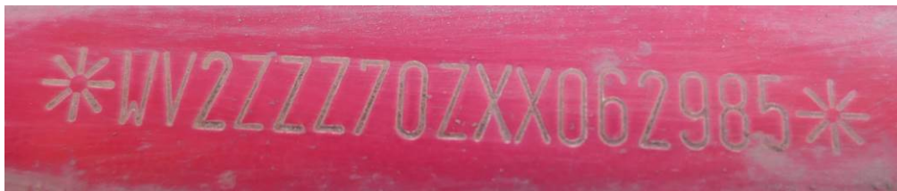
Fot. 12. VW Transporter