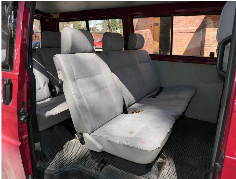
Fot. 8. VW Transporter