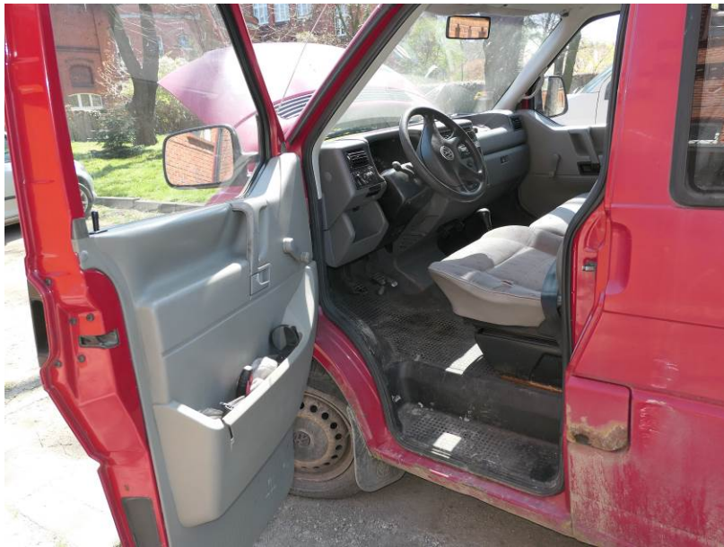
Fot. 6. VW Transporter