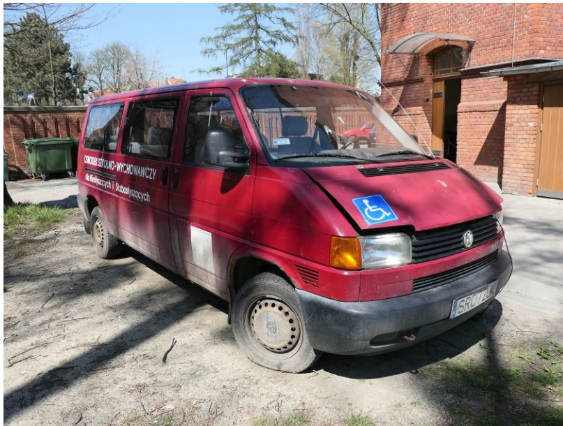
Fot. 4. VW Transporter