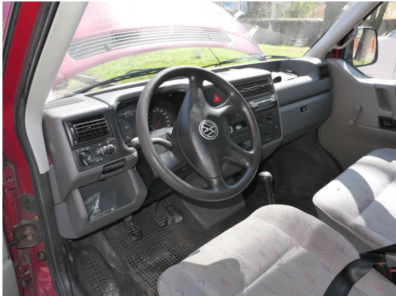
Fot. 7. VW Transporter